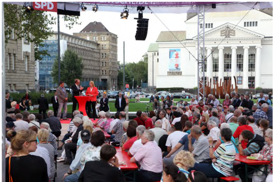
Volles Rundzelt - schon vor der Ankunft von Sigmar Gabriel

am Dienstag war der SPD-Vorsitzende Sigmar Gabriel auf dem König-Heinrich-Platz. Ein echtes Highlight. Er hätte eine fulminante Wahlkampfrede halten können, schließlich bietet Schwarz-Gelb genug Angriffsfläche. Die SPD aber setzt den modernen Bürger-Dialog fort: Wir klopfen an die Türen der Menschen, wir suchen das (Wohnzimmer-)Gespräch und der SPD-Vorsitzende stand den Menschen in Duisburg auf Augenhöhe zum „Klartext Open Air“ Rede und Antwort. Viele Fragen betrafen die Zuwanderung aus Südosteuropa. Im April hatte sich Sigmar ein Bild der Lage in Duisburg gemacht und wir waren uns da schon einig: Wir müssen darauf achten, dass uns die Nachbarschaften nicht auseinanderbrechen. Ich sage klar - gerade nach den Vorfällen vom vergangenen Freitag in Rheinhausen: Niemand hat das Recht, anderen zu verbieten, über seine Probleme zu reden. Ich lehne Gewalt von allen Seiten ab, sowie ich rechte Stimmungsmache ablehne. Zuwanderer und Anwohner brauchen keine Rechtspopulisten, die ihre schwierige Situation ausnutzen. Deshalb war ich gestern