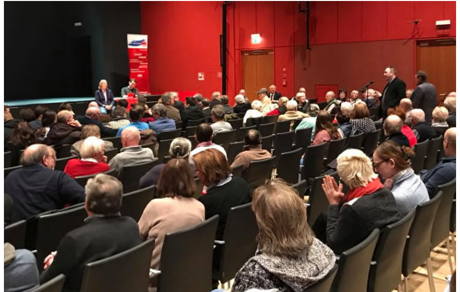
Mitgliederkonvent in der Mercatorhalle: Eine leidenschaftliche und faire Debatte zum Thema GroKo gab es auch am Sonntag bei der SPD Duisburg mit rund 250 Mitgliedern.